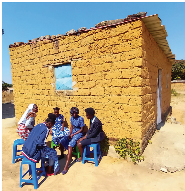
Jedna z dotychczasowych kaplic wspólnoty w Keve